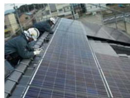
屋根工事は専門の屋根職人が確かな施工を致します。

太陽光発電システムはそれぞれのお宅によって施工方法が違ってきます。そのお宅に合った施工をしないと、将来雨漏りや電気のトラブルが起きてしまう可能性があります。太陽光発電システムは設置後20~30年と活躍するものです。メイデンは、お客様に何の心配もなく、長く安心、安全にお使いいただくためにこだわった施工をさせていただきます。