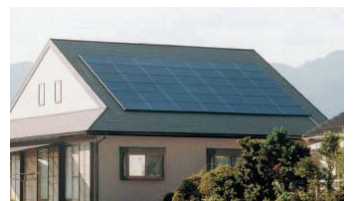
お客様にご満足いただける施工を心掛けております。

お客様のお宅に合ったシステムを提案いたします。【見積無料】まずはお気軽にお問合せください!!