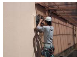
電気工事は中電認定工事店のメイデンが責任を持って施工致します。